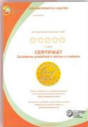
Obr. 3 Certifikát