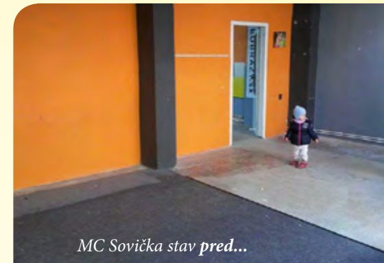
MC Sovička stav pred...

S pomocou mesta a nekonečnou podporou našich manželov, ktorým taktiež patrí jedno veľké ĎAKUJEM, sa naše predstavy začali stávať skutočnosťou. Vytvorili sme priestor, ktorý môžu naše mamičky spoločne s deťmi navštevovať. Začali sme fungovať v zime 2016 a odvtedy sa snažíme vytvoriť jednoduché a atraktívne prostredie, kde