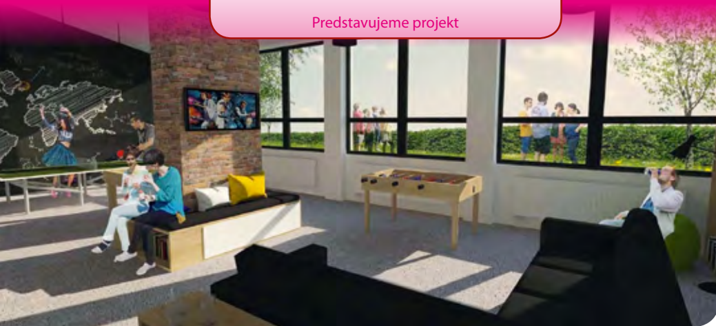
Návrh_ spoločenská miestnosť