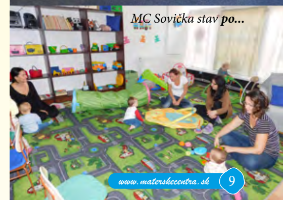
MC Sovička stav po...