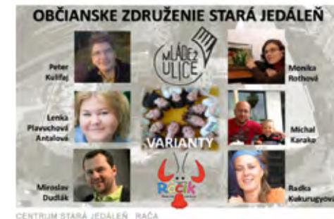
CENTRUM STARÁ JEDALEŇ, RAČIK